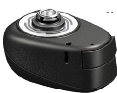
Cochlear™ Baha® 7 attacco snap corto