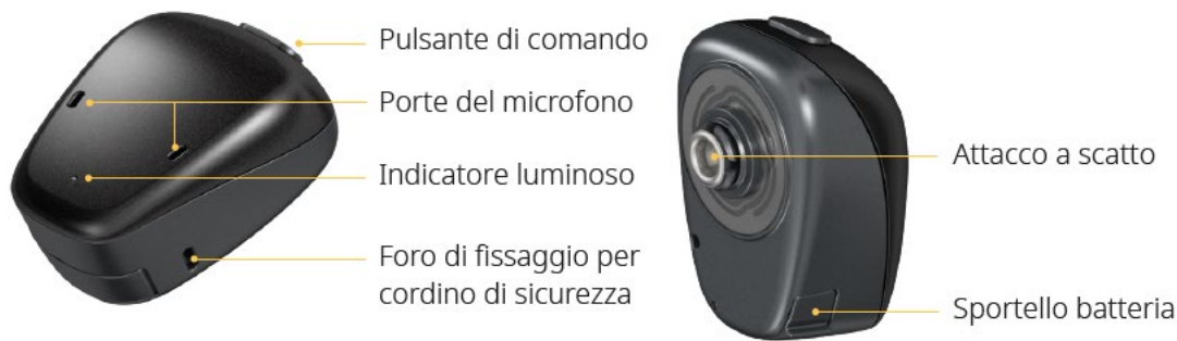
Figura 3: processore del suono Cochlear Baha® 7

Per accendere e spegnere il processore del suono si utilizza lo sportello batteria.