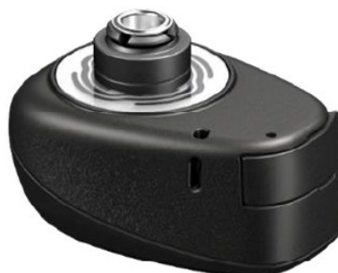
Cochlear™ Baha® 7 mm attacco snap lungo